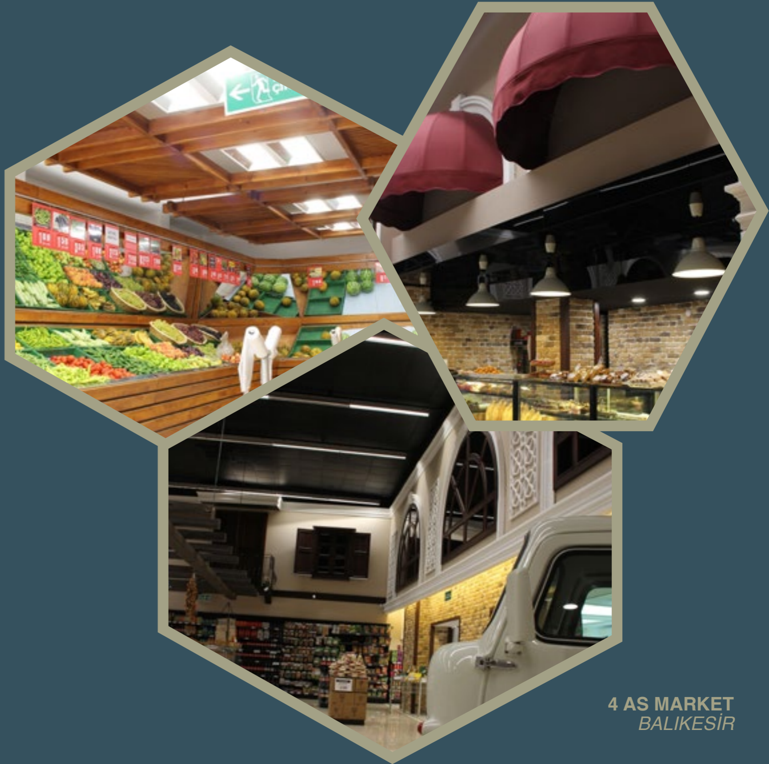
4 AS MARKET BALIKESİR