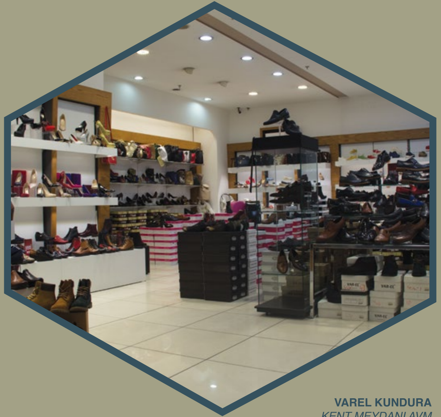
VAREL KUNDURA KENT MEYDANI AVM